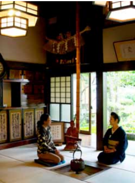
受到當地人仰慕，爽朗的老闆娘溫暖地迎接旅人的到來。