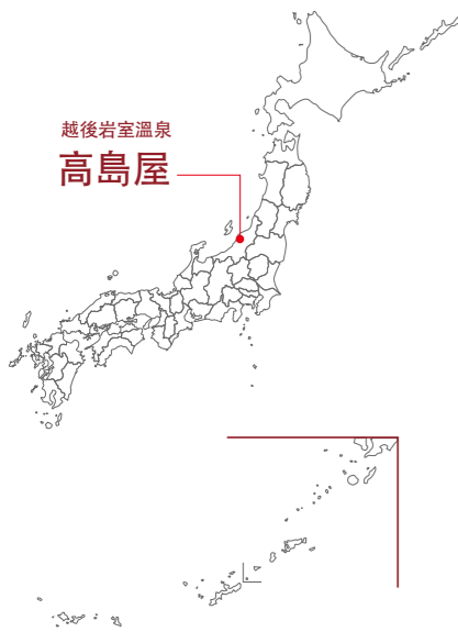
越後岩室溫泉 高島屋

造訪位於越後岩室溫泉旅館——高島屋的名人非常多，曾在此地渡過一晚的歌手武田鐵矢在歸途中說道：「任何事物都恰到好處」。對於越後人來說，高島屋是一間人盡皆知的庄屋（古代村里行政官）旅館；但是，從遠方來訪且習慣旅行的人們都會迷上它的原因是什麼呢？