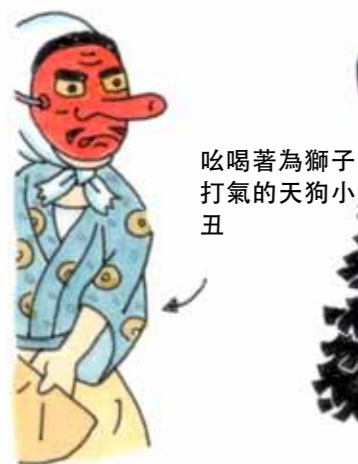
吆喝著為獅子打氣的天狗小丑