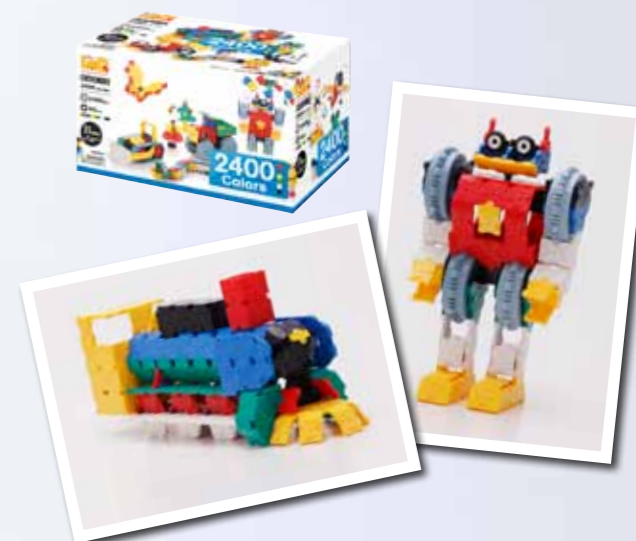
★「LaQ ベーシック 2400 カラーズ」¥16,800

子どもから大人まで夢中になる立体ブロック ティラノサウルスやチンパンジー、クワガタなどをリアルに作るこ ができる立体ブロック「LaQ (ラク्यू)」。従来のブロックに比べて 複雑な形が作れるので楽しく、しかも子どもの脳の発育を促進させ ると人気だ。「LaQ ベーシック 2400 カラーズ」は2400個のパーツと ハマクロンと呼ばれる可動パーツ、「LaQ イマジナルシリーズ 女の子 セット」は、カチューシャやハンドバッグなどのパーツセット。 ●ヨシリツ TEL.042-382-3955