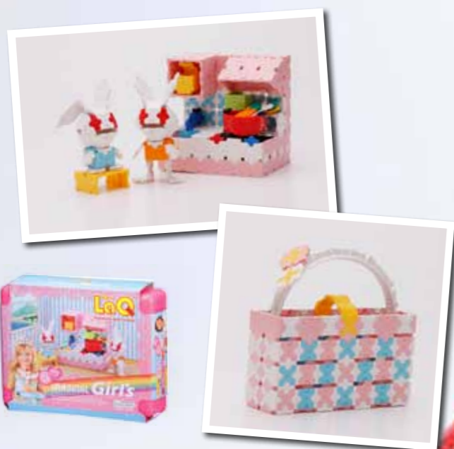
★「LaQ イマジナルシリーズ 女の子セット」¥5,040