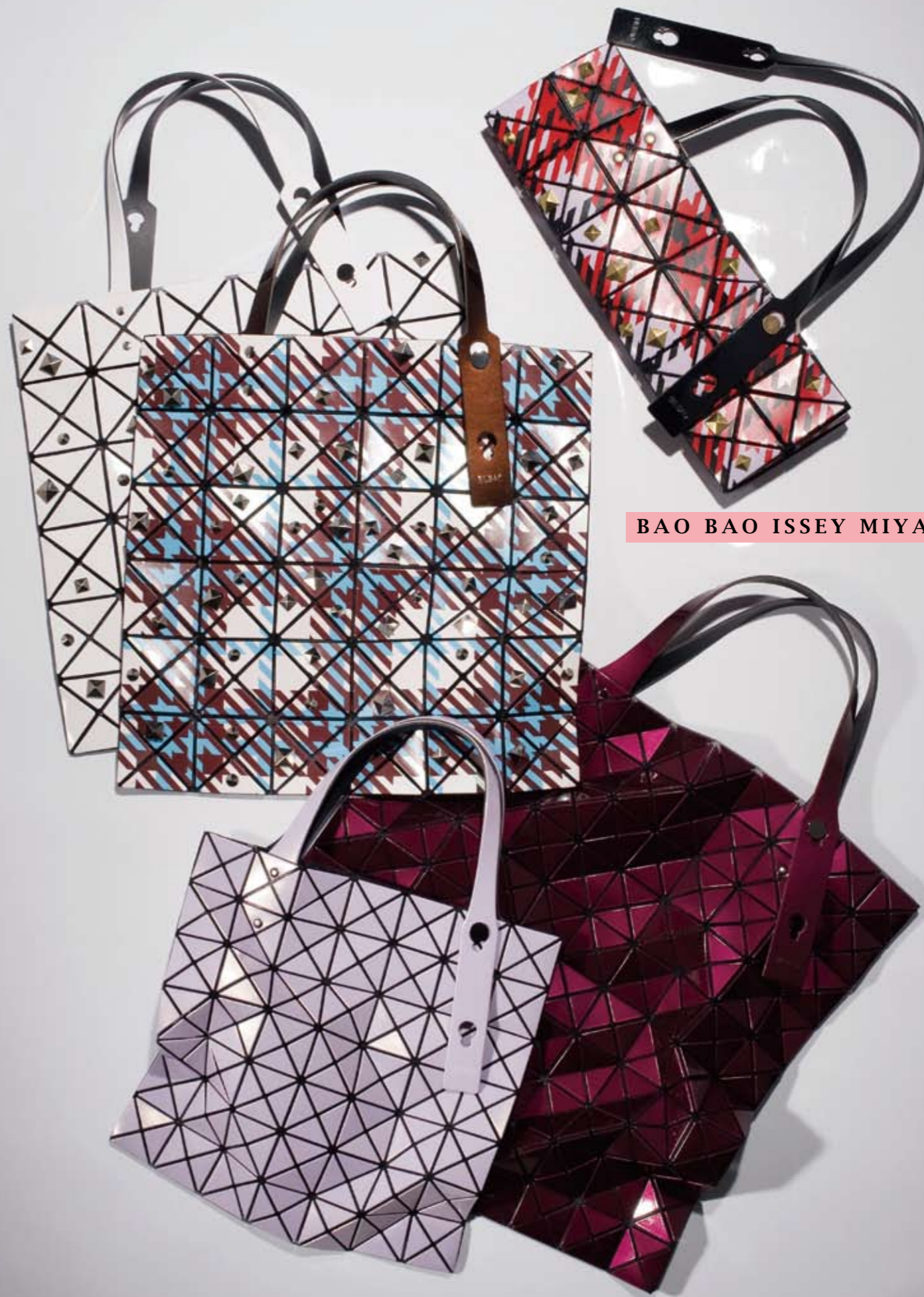
BAO BAO ISSEY MIYAKE

一包在手，既可以作大包使用，又可以弯折成小包使用。无论是日常还是旅行都非常适合。最重要的是这款包包时尚而又富于变化。