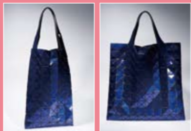
“BILBAO PRISM 2” 2万 8350 日元。从横宽形到竖长形，一个包可以产生如此多的形状变化。包的形状制作方法堪称无限！