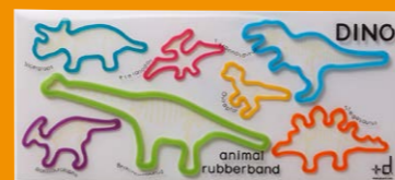
+d (h concept) www.plus-d.com